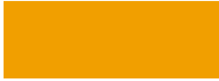
306 Amarillo Cromo