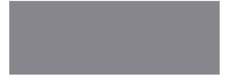
302 Gris Maquinaria