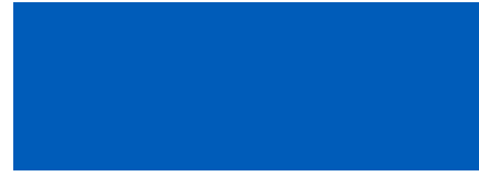
340 Azul Acuario