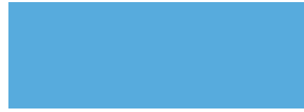
320 Azul Cielo