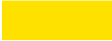
312 Amarillo Limón

Esmalte Alquidático Anticorrosivo - Exteriores / Interiores