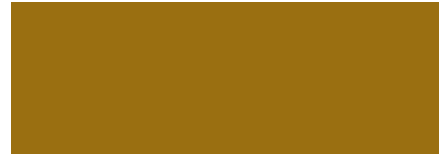
315 Amarillo Ocre