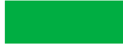
341 Verde Acuario