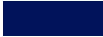
303 Azul Fuerte