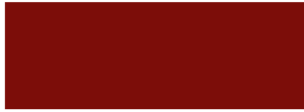
304 Rojo Óxido