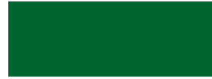
313 Verde Bosque