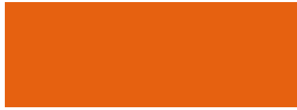
342 Naranja Acuario